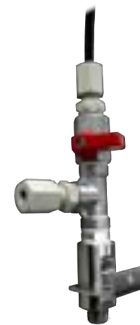
5015-02 Kugelhahnventil mit Schnellverschluss und Sicherheitsblech